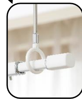
四角い物干し竿 (別売)