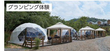
グランピング体験