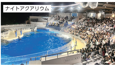
ナイトアクアリウム

魚つかみ取り&潮干狩り体験は手ごろな参加費で、直行の貸切列車で連れて行ってもらえて期待以上の体験ができました