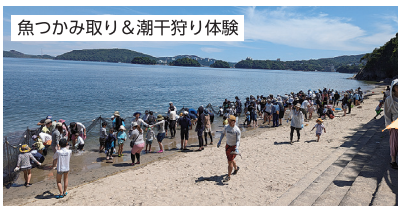
魚つかみ取り&潮干狩り体験

組合員の交流と親睦を目的に家族や職場で参加できるイベントや日帰りツアーを実施。互助組合のオリジナル企画なので、個人では体験できない特別なメニューが楽しめます。