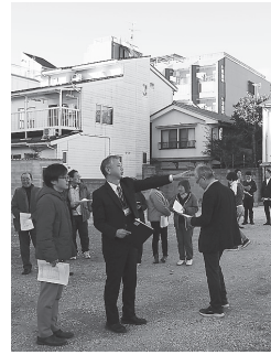
建築予定地を見学する理事会

担保に入れることになりました。それに関わって、互助組合の所有する土地（駐車場の一部）の上にB棟が建つことから互助組合の土地を担保に入れるための決議が理事会で全会一致で承認されました。