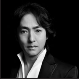
秋川 雅史 AKIKAWA masafumi

声楽家 子供の頃より童謡歌手として活躍。 東京芸術大学、大学院修士課程修了。 NYジュリアード音楽院、ロチェスターイーストマン音楽院に学ぶ。 妹の由紀さおりとのコンサートは38年目を迎え、美しい日本語の歌を次世代へ…という思いで活動を続ける。 2013年と2021年に文化芸術への貢献が評価され文部科学大臣より表彰を受ける。